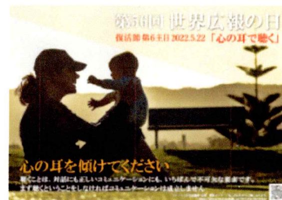
第56回広報の日ポスター ダウンロード（PDF 1.57MB）