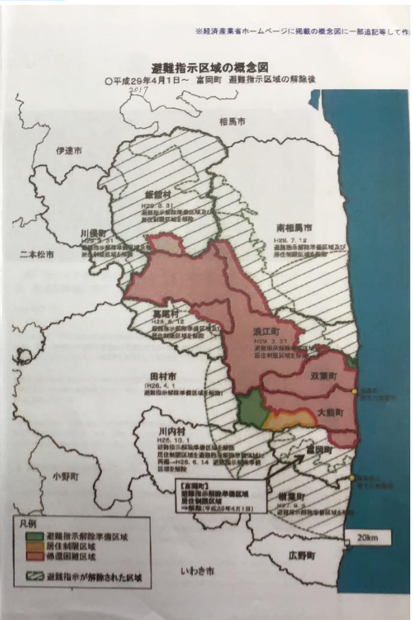
2012 年原発から半径 20 キロ圏内半円形（避難指示区域）